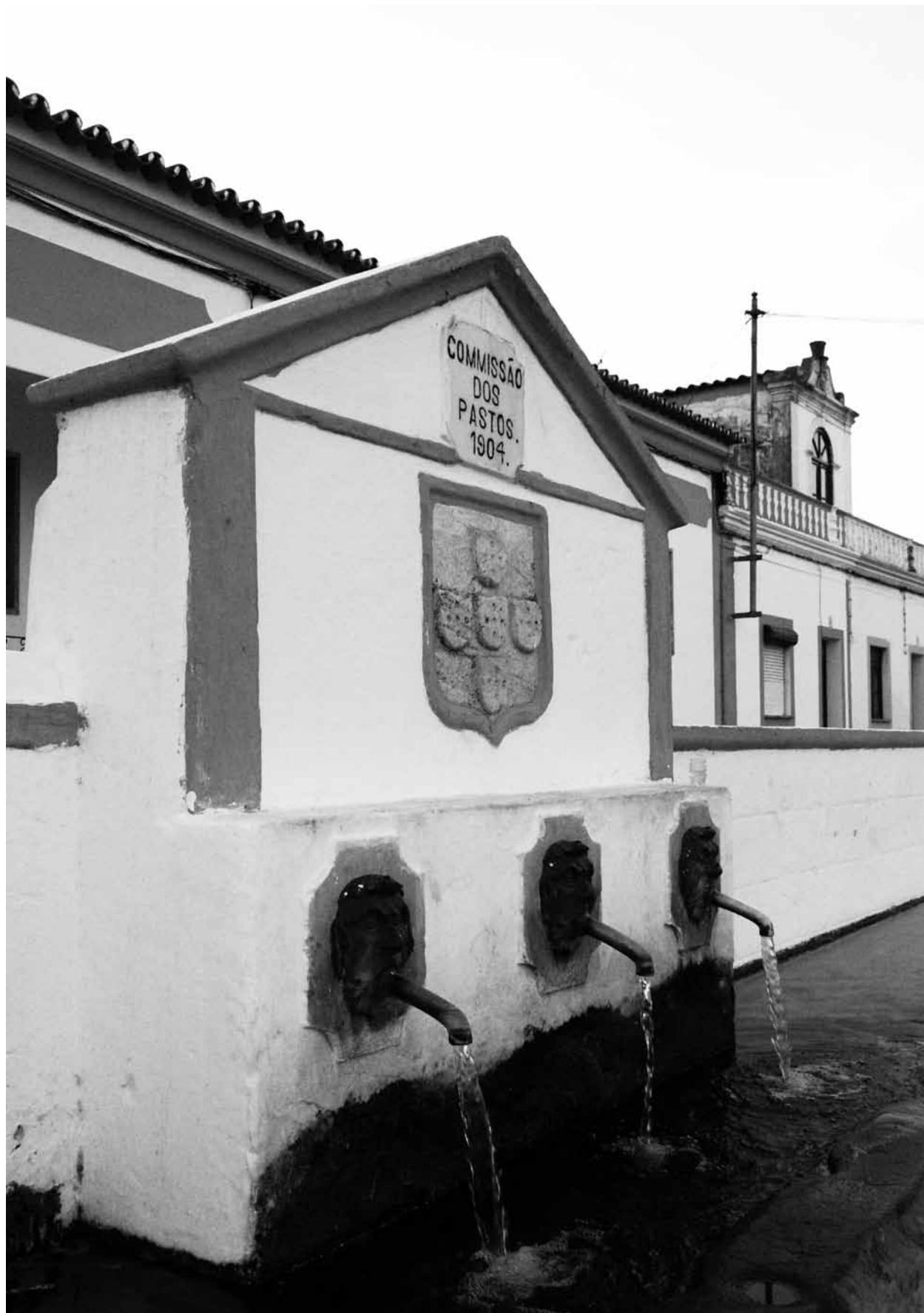
Fonte e Chafariz do Rossio da Fonte Coberta - Viana do Alentejo