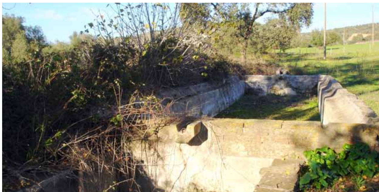
Lavadouro e tanque de Vila Lobos, numa fotografia de 2005.