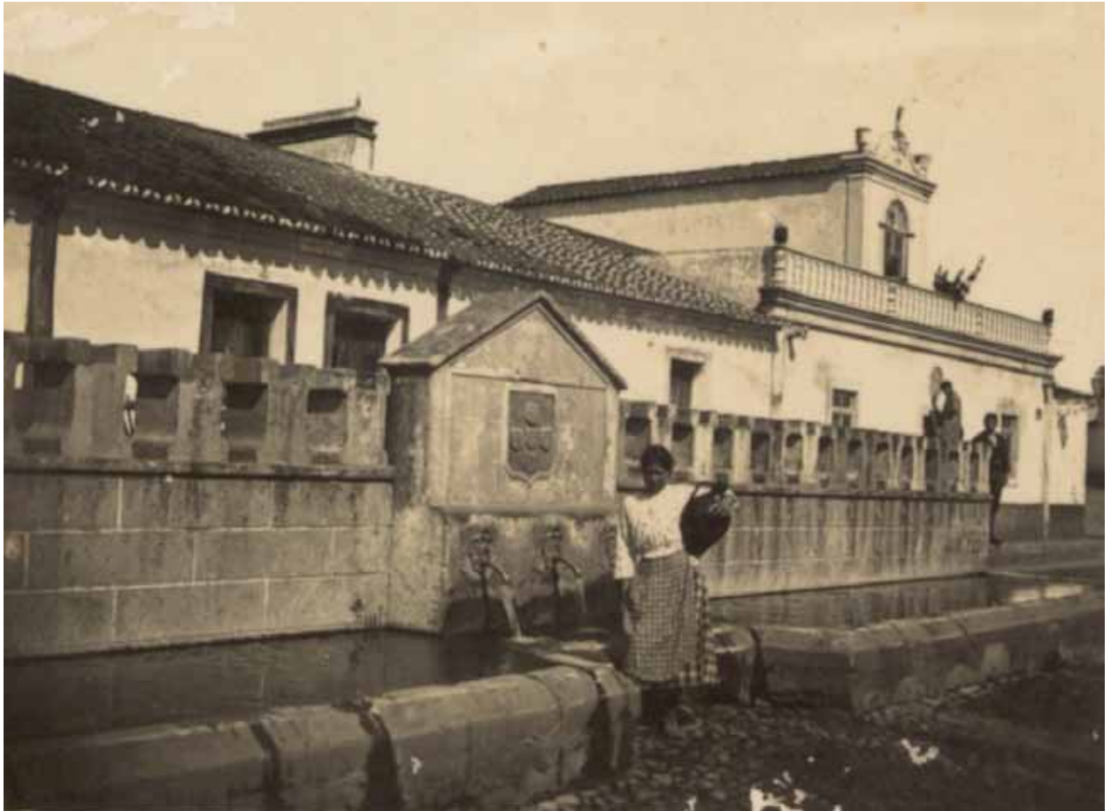
Fonte e chafariz do Rossio da Fonte Coberta, por volta de 1925. O coroaamento simulando “merlões” ou “ameias”, foi destruído, por ordem da Câmara, durante a década de sessenta do século passado, “por dar muito trabalho a cair”... (Fotografia de Viriato Campos, da coleção do autor).