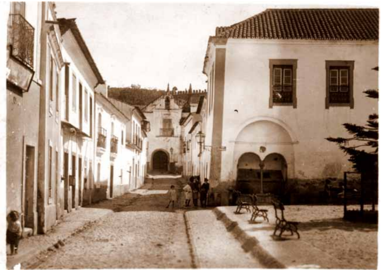
Viana do Alentejo por volta de 1930. Ao fundo, no castelo, é visível a janela de sacada da Junta de Freguesia, tendo por cima o sino da Câmara (recentemente restaurado). A fonte da praça ainda apresenta a sua caixa de água. No lugar actualmente ocupado pelo busto de António Isidoro de Sousa existiu, durante décadas, uma enorme araucária, parcialmente visível na fotografia. Os candeeiros funcionavam a petróleo. Fotografia de Viriato Campos, colecção do autor.